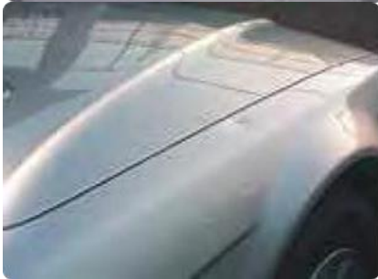
Een ontbrekende of verwijderde antenne