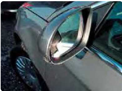
Afgerukte of loshangende spiegels