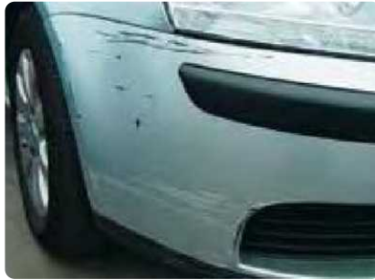
Beschadigingen op deze onderdelen groter dan een creditkaart