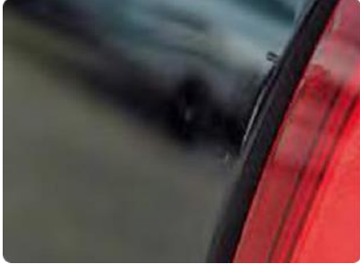
Een kras tussen de 2 en 10 cm