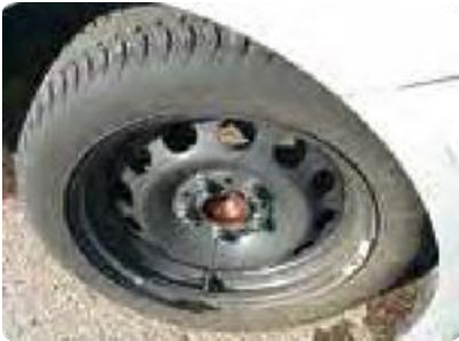
Ontbrekende wioldoppen of velgen