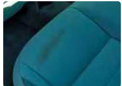
Een interieur dat zo vuil is dat reiniging of reparatie noodzakelijk is