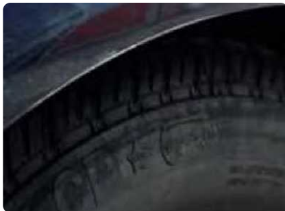
Een kras tussen de 2 en 10 cm