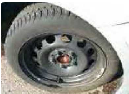
Ontbrekende wioldoppen of velgen