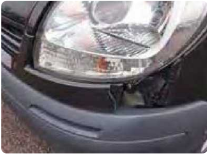
Gebroken, gebarsten, vervormde of losgelaten bumpers, grillsof stootstrips