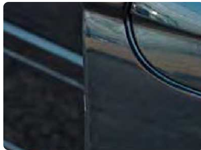
Een kras tussende 2 en 10 cm