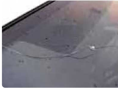
Krassen op de voorruit of steenslagschade