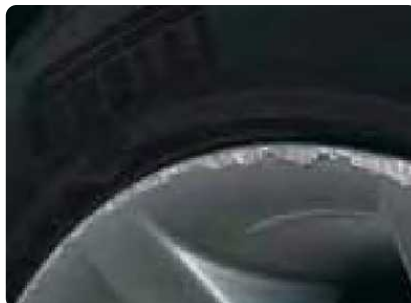
Gebarsten of gekraste velgen of wioldoppen