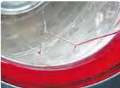
Een gebarsten voorruit met een begin van scheurvorming