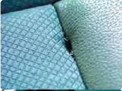
Scheuren, gaten of krassen in het auto-interieur