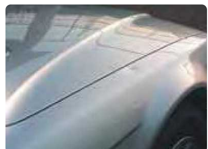
Deukjes van meer dan 2 mm diep, of groter dan een muntstuk van 50 eurocent