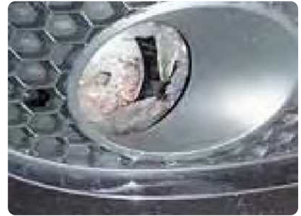
Een scheur of een gat in een koplamp of mistlamp