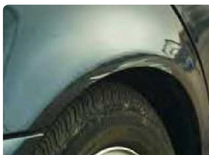
Krassen tussen de 2 en 10 cm in een grotere hoeveelheid dan aanvaardbaar geacht