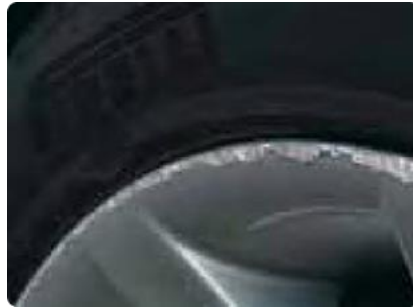
Gebarsten of gekraaste velgen of wioldoppen