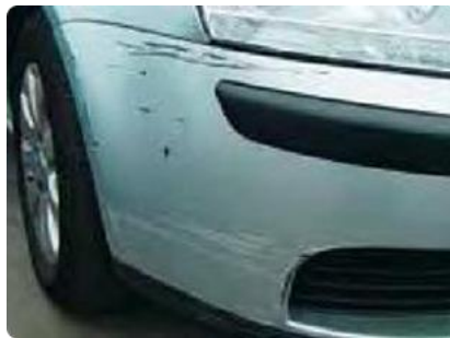
Beschadigingen op deze onderdelen groter dan een creditkaart