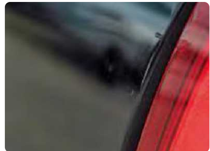
Een deuk kleiner dan een muntstuk van 50 eurocent