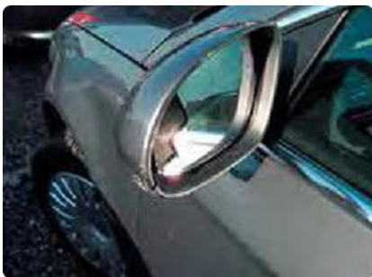
Afgerukte of loshangende spiegels