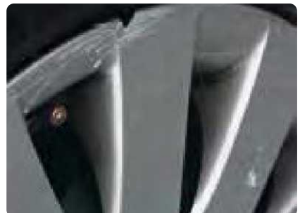
Zichtbare vervorming aan een velg of wioldop