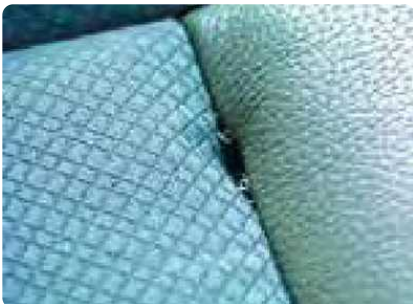
Scheuren, gaten of krassen in het auto-interieur