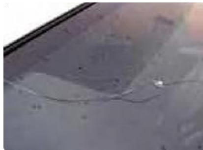
Krassen op de voorruit of steenslagschade