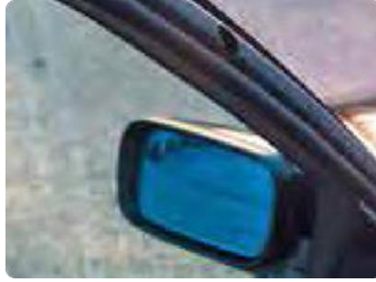
Beschadigen aan interieur door gedemonteerde accessoires