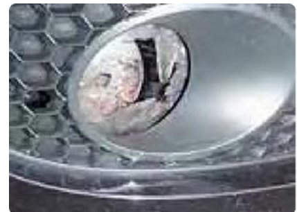
Een scheur of een gat in een koplamp of mistlamp