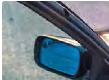
Beschadigingen aan interieur door gedemonteerde accessoires