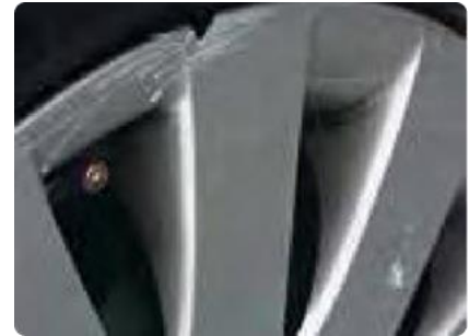
Zichtbare vervorming aan een velg of wioldop