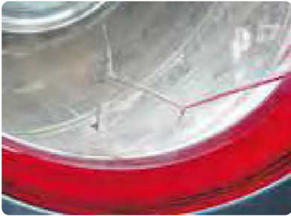
Een gebarsten voorruit met een begin van scheurvorming