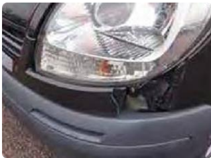
Gebroken, gebarsten, vervormde of losgelaten bumpers, grills of stoot strips