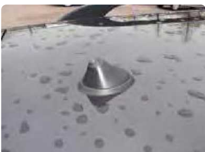
Een ontbrekende of verwijderde antenne